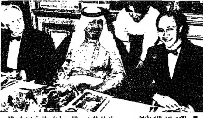
الأمير عبد الله يشاطر لوران فيبوس (اليسار) وغاستون بيفر (اليمين) بمسألة لثانية. خلال المائدة التي أقيمت على شرفه في وزارة العلاقات الخارجية الفرنسية

باريس - من بلخوس الفغالي: أكد الأمير عبد الله بن عبد العزيز ولي العهد وثالث رئيس مجلس الوزراء ورئيس الحرس الوطني السعودي أنه ورئيس الفرنسي فرانسوا ميتران متفقان بشأن كثير من القضايا الدولية وخصوصاً تنمية العلاقات الثنائية. وقال الأمير عبد الله الذي يقوم بزيارة رسمية تستمر ثلاثة أيام إلى باريس في بيان بعد اجتماع على الغداء مع الرئيس ميتران، «أؤكد بسورون وجهات نظرنا كانت متطابقة بشأن معظم القضايا التي بحثنا فيها» وأضاف بقول إن المحادثات بشأن الشؤون الدولية وخصوصاً قضايا الشرق الأوسط كانت صريحة وودية وتعكس تنمية العلاقات الثنائية في كل الحقل وروابط الصداقة بين البلدين. ولم يخط البيان الذي تلاه السفير السعودي جميل جيجان أية تفاصيل عن المحادثات. والموقف الفرنسي في لبنان، علم في الدوائر الفرنسية أن فرنسا أظهرت اهتماماً بفرنسية لتكثيف المبادرات في مجال الاستعمار التي يرى الجانب الفرنسي أنها ليست على مستوى المبادرات التجارية والصداقة بين البلدين. وأعربت فرنسا عن رغبتها في أن تتجه هذه الاستثمارات التي تتركز حالياً في مجال العقارات غير المغنونة أكثر نحو الصناعة والتكنولوجيا. وأضاف المصدر نفسه أنه فيما يتعلق بالمشكلة الفلسطينية الخاصة ببيع المنتجات البترولية السعودية في أوروبا والتي توقفت أيضاً خلال الاجتماع الذي عقد لدى رئيس الوزراء فان فرنسا لن تكون ضد هذا التصريح الاتحادي السعودي ولكنها كانت تتبنى الإنعاش السعودي والعلاقات في مجال التجارة.